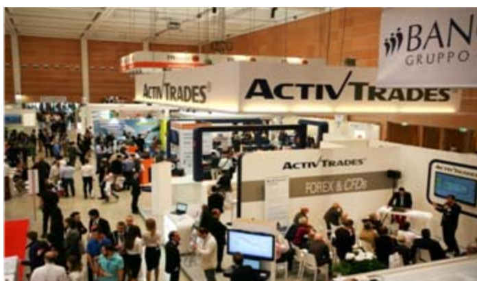
Convention aziendale, area espositiva