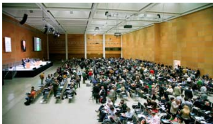
Congresso nazionale medico-scientifico, sala divisa