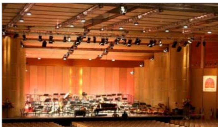
Evento culturale, appendimenti