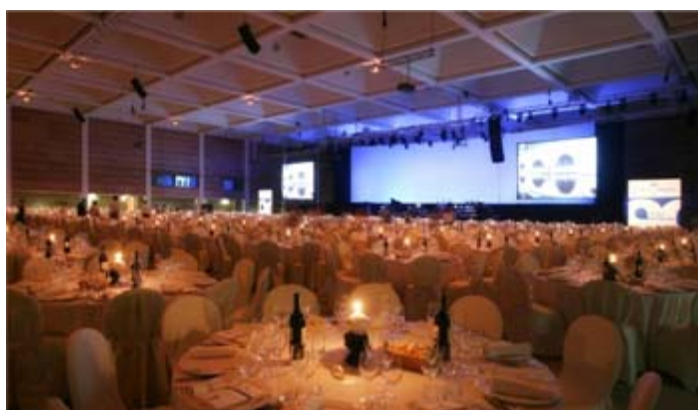
Convention aziendale, area catering